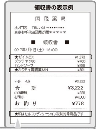
領収書に控除の対象であることが記載されています。

セルフメディケーション税制の対象とされる医薬品は、購入した際の領収書（レシート）に控除対象であることが記載されています。